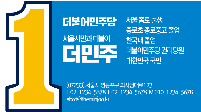
후보자 명함 D안 앞면